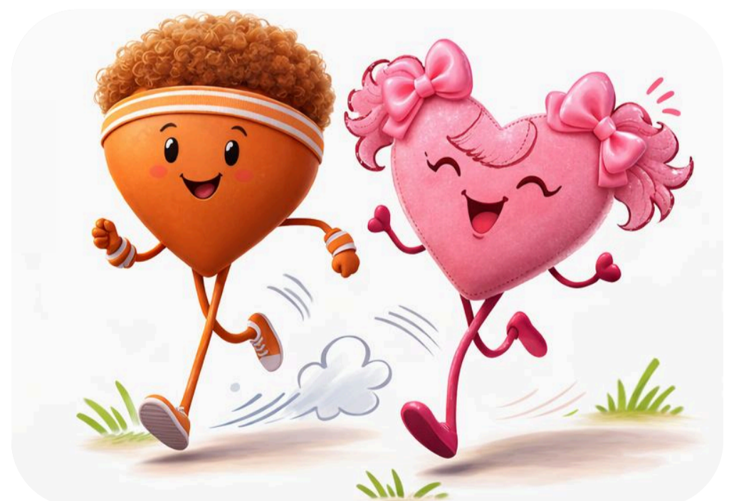
Corrida no parque